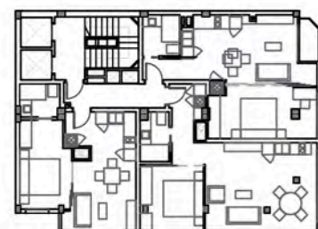
Planta 3ª y 8ª (P) Sup. construida 163,71 m 2