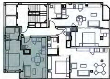
3ª a 8ª

Planta Ático (1) Superficie construida 10,71 m 2