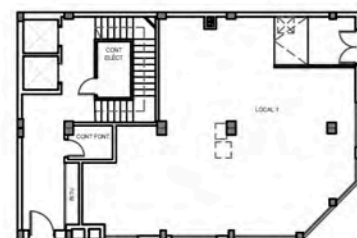
Planta baja (P) Sup. construida 163,71 m 2