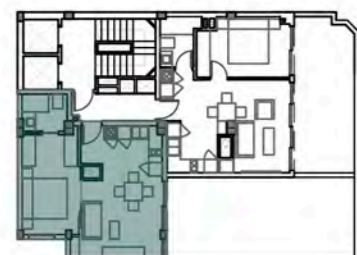
Planta ático (P) Sup. construida 163,71 m 2