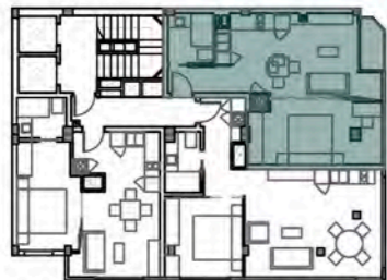
3º a 8º