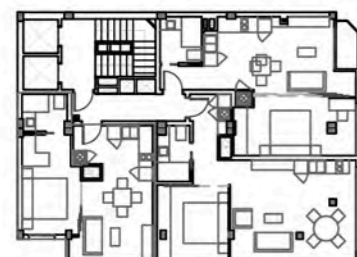
Planta segunda (P) Sup. construida 163,71 m 2